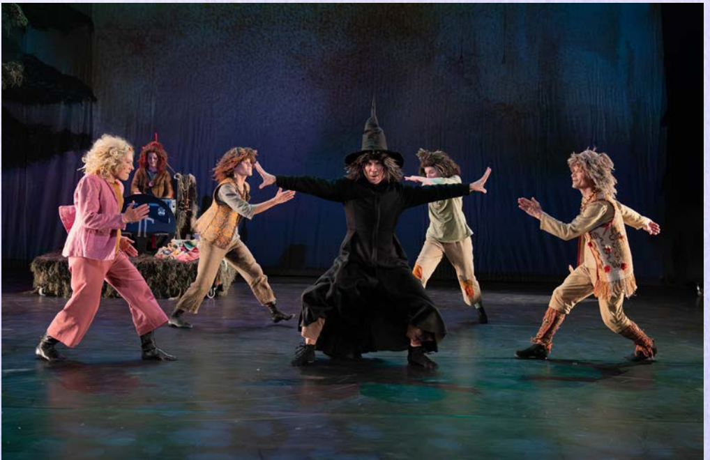
Esityskuvat: Tuukka Ylönen